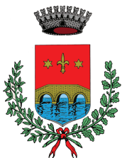
Ponte San Nicolò (Italija)